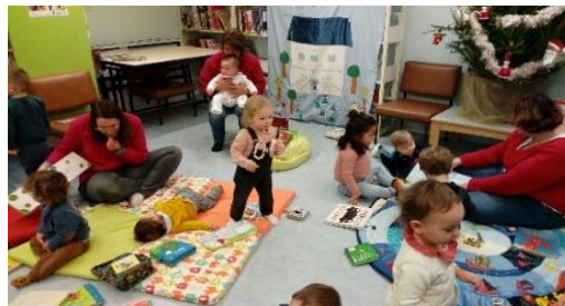
A quatre pattes dans les livres - Ouireham