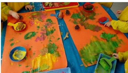
Peintures et petits trésors d'Automne