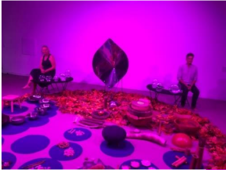
Spectacle de Noël « Avant les mots » Hermanville s/Mer